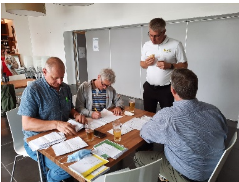
Telbureau in actie