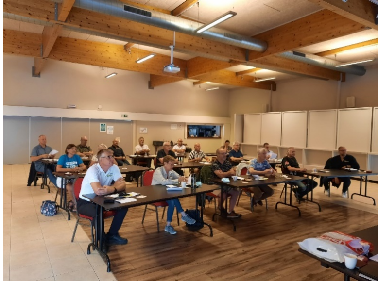
Vertegenwoordiging van de verschillende duikclubs