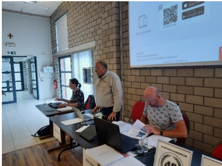
Voorzitter aan het woord