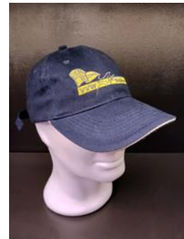
Muts en Pet 10€