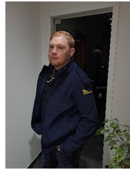
Softshell Jacket Dames Heren 62 €