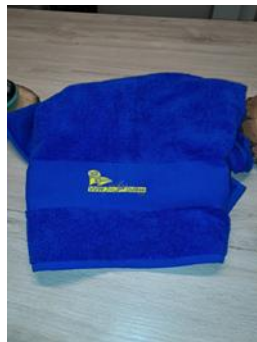
Strand laken 18 €