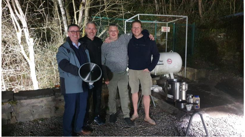
Het organiserend team Regio Limburg

Niet minder dan honderd enthousiaste duikers van over gans België meldden zich voor deze vierde nachtduik. Een succes net zoals de voorgaande edities.