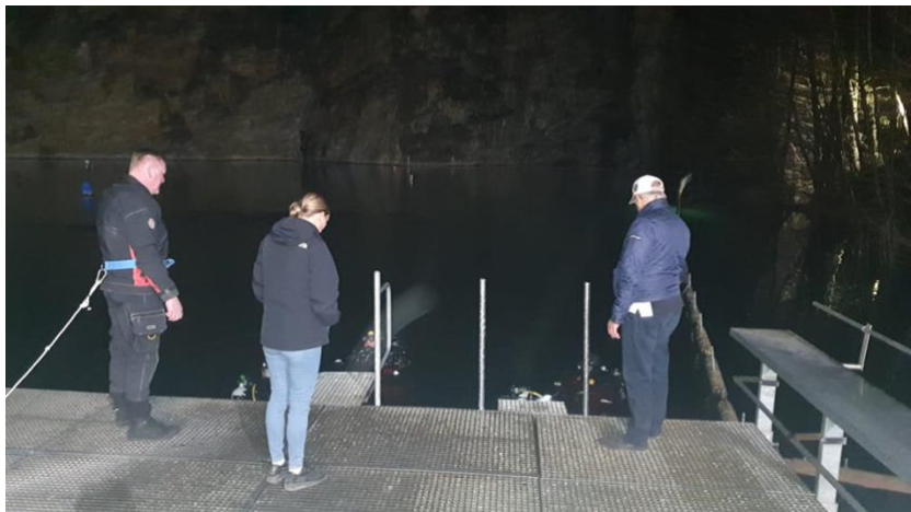
Veiligheidsploegen op ponton

Eens in het water zie je het verschil met een duik die plaatsvindt tijdens de dag. De meeste vissen zijn al slapen en andere vissen, zoals de snoek, echte rovers, worden zeer beweeglijk. Op een diepte van -28m wordt het zicht plots veel beter. Tegen de wand plakt een thermometer en geeft ons een temperatuur van 7,2°C. aan. Gelukkig duiken de meesten met een droogpak. Sommigen gaan zelfs zo ver dat ze een elektrische verwarmingsvest extra aantrekken. Plots duiken twee snoeken voor ons op, we volgen hun weg maar plots ... net zoals ze tevoorschijn kwamen, waren ze ook weer verdwenen. Met ons kompas in aanslag doken we verder. Op -20m, treffen we een militair voertuig aan, een licht infanterievoertuig. Ook hier troffen we een paar snoeken aan.